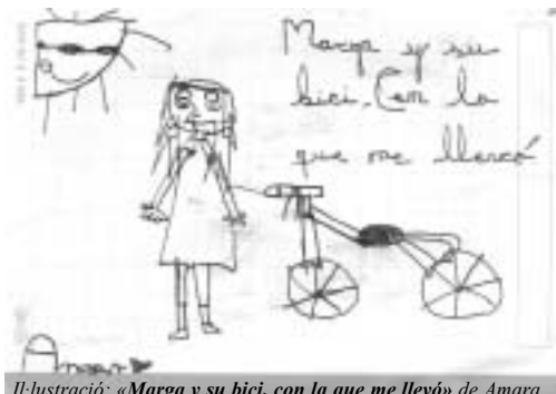
Il·lustració: «Marga y su bici, con la que me llevé» de Amara