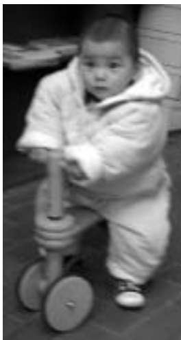
La Lluna donant les seves primeres pedalades